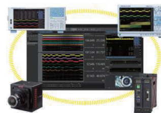
統合計測ソフトウェアプラットフォーム IS8000（別売）

DL950は、インバータや電源などのフローティング電圧計測のほか、温度や振動などの各種センサーを直接接続でき、計測対象に応じて組み換え可能なプラグインモジュールを用意しました。