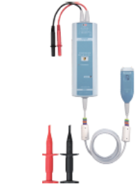
高電圧差動プローブ 702921/702922 (別売)

DLM3000HDシリーズは、12ビットの垂直軸分解能に対応したオシロスコープです。