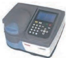
Thermo Scientific™ GENESYS™ 30 可視分光光度計