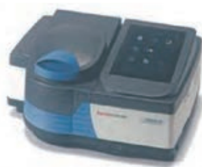
Thermo Scientific™ GENESYS™ 40可視分光 光度計／GENESYS™ 50紫外可視分光光度計