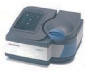
Thermo Scientific™ BioMate™ 160／ Thermo Scientific™ GENESYS™ 180 紫外可視分光光度計