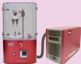
コンビニ・エバポ C4 ライト