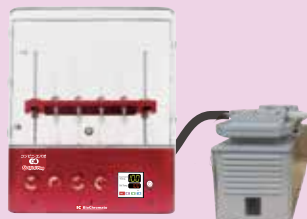
コンビニ・エバポ C4