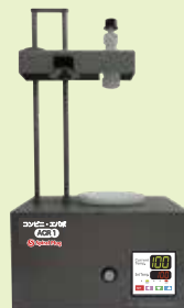
コンビニ・エバポ ACR1