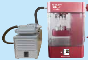
コンビニ・エバポ C10 ライト