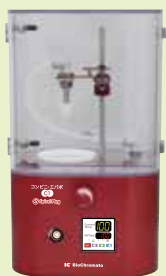
コンビニ・エバポ C1