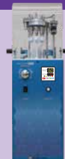
コンビニ・エバポ MT8

※1.5mL/5.0mL マイクロチューブに対応 (エペンドルフ社容器を基準に設計しております)