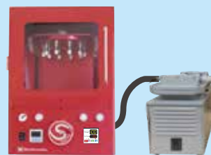
コンビニ・エバポ C10

HP でユーザーズボイス公開中！ https://www.bicr.co.jp/