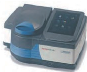
Thermo Scientific™ GENESYS™ 40可視分光 光度計／GENESYS™ 50紫外可視分光光度計