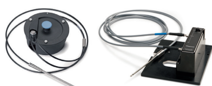
ファイバー光学プローブ