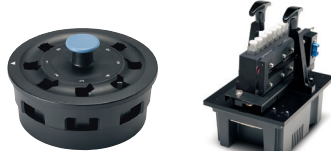
8連セルチェンジャー