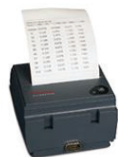
スナップオンプリンター