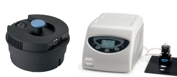
ペルチェ温調システム