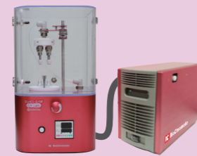
コンビニ・エバポ C4 ライト