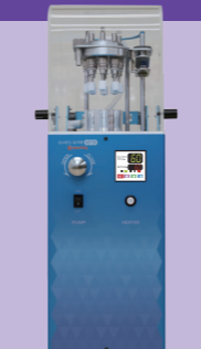
コンビニ・エバポ MT8

※1.5mL/5.0mL マイクロチューブに対応 (エッペンドルフ社容器を基準に設計しております)