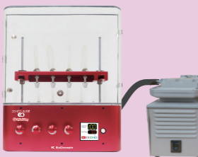
コンビニ・エバポ C4