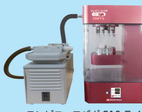
コンビニ・エバポ C10 ライト