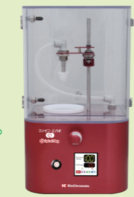
コンビニ・エバポ C1

※上記は、カラーSun(赤)の価格となります。 その他のカラーは 22.5 万円です。 ※C1用推奨ポンプあります。 お問合せください。