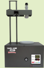
コンビニ・エバポ ACR1