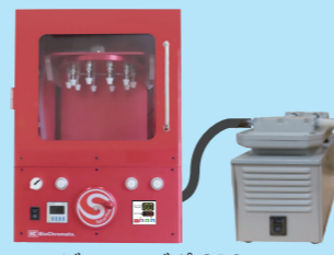
コンビニ・エバポ C10

HP でユーザーズボイス公開中！ https://www.bicr.co.jp/