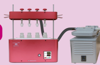
コンビニ・エバポ K4