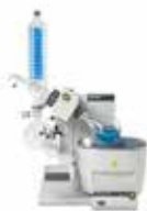
ロータリーエバポレーター R-300 単体