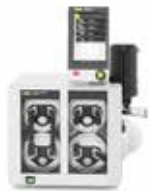
ダイヤフラムポンプ V-603Pro