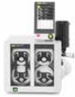
ダイヤフラムポンプ V-603Pro