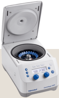
Centrifuge 5425 冷却なし

人気の卓上微量遠心機をお得に手に入れましょう！冷却機能の有無・チューブの本数に合わせて選択いただけるよう、各モデルが対象機種になっています。本体と同時購入で対応するローター各種も 30%OFF。半周回すだけで開閉ができる QuickLock® 付きローターリッドも用意、ハンドルをクルクル回す必要はもうありません。また、コンタミネーションリスクを低減するコンセプトで作られた CO 2 インキュベーターも特別価格でご提供します。