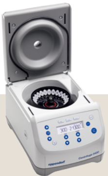
Centrifuge 5420 冷却なし

設定温度に迅速に到達できる FastTemp 機能付き 6 種類のローターに対応 ローター FA-24x2 付