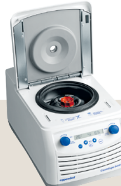
Centrifuge 5418 R 冷却付き

実験台でも省スペースを実現 遠心後に自動でドアオープン 作業の操作性が向上します ローター FA-24x2 付