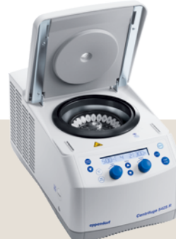
Centrifuge 5425 R 冷却付き

加減速を各 10 段階で設定可能 静かな運転音を実現 6 種類のローターに対応 ローター FA-24x2 付