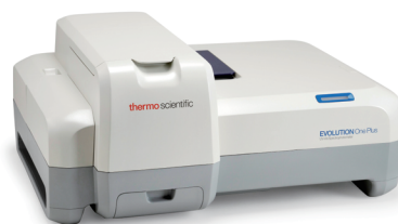
Evolution One Plus 紫外・可視分光光度計