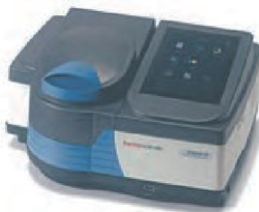
Thermo Scientific™ GENESYS™ 40 可視分光 光度計 / GENESYS™ 50 紫外可視分光光度計