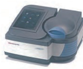
Thermo Scientific™ BioMate™ 160 / Thermo Scientific™ GENESYS™ 180 紫外可視分光光度計