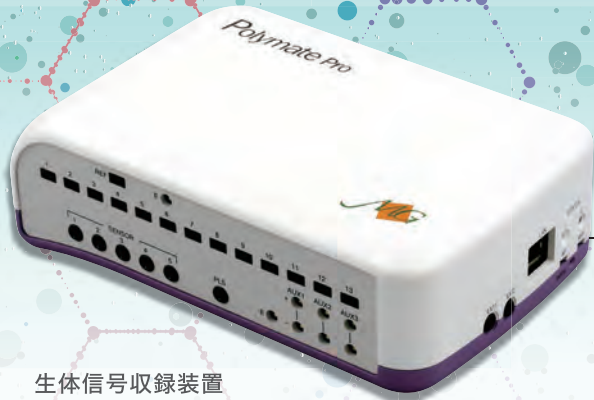
生体信号収録装置 ポリメイトプロ MP6000