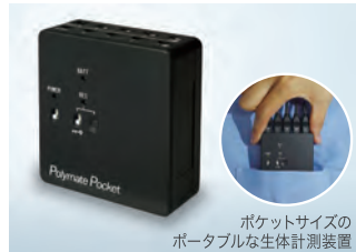
ポケットサイズの ポータブルな生体計測装置